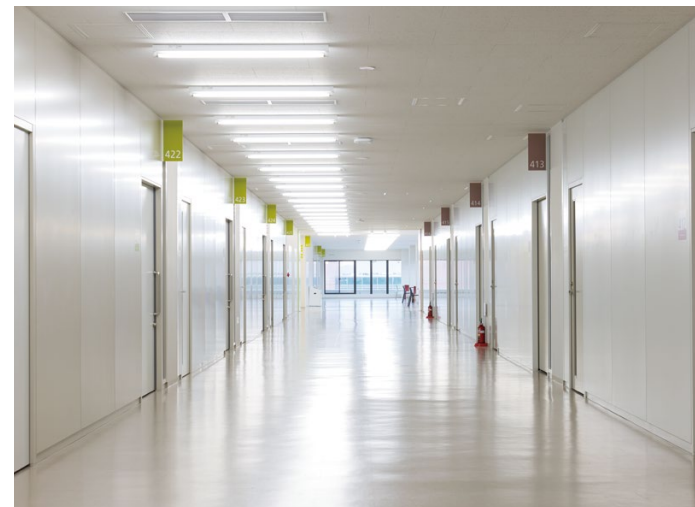
天井材:ロックウール化粧吸音板 ダイロートン トラバーチン9mm 耐震天井工法:ダイケンハイブリッド天井