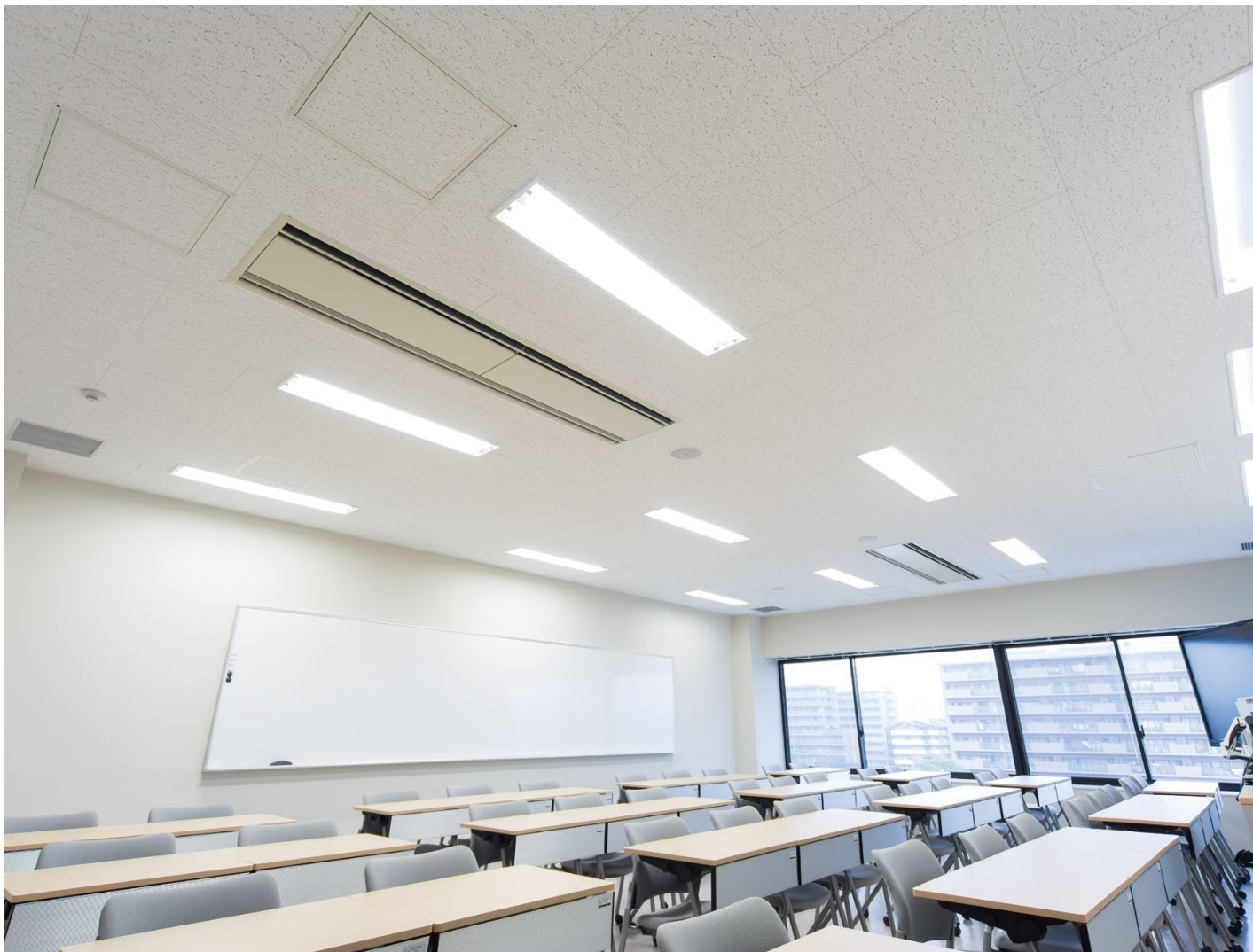
天井材:ロックウール化粧吸音板 ダイロートン トラバーチン9mm 耐震天井工法:ダイケンハイブリッド天井