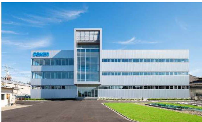
DAIKEN R&D センター 外観

「WELL Performance Rating」とは、米国の公益企業International WELL Building Institute (IWBI)による建築物の空間評価システムで、人の健康とウェルビーイング(身体的、精神的、社会的に良好であること)に影響を与える様々な機能を測定・評価するWELL認証から派生した、建物の室内環境品質に特化した評価制度です。「室内空気質、水質管理、照明測定、温熱条件、音響性能、入居者体験」の6つの視点で、エビデンスに基づく第三者検証により評価されます。