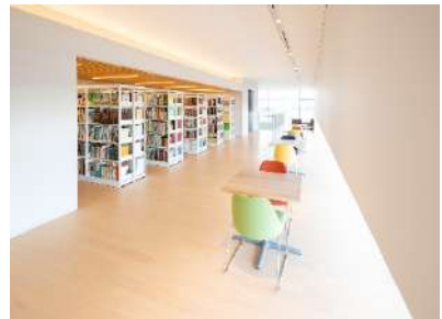
休息スペースを備えた図書室