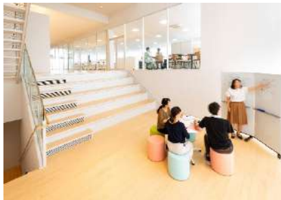
交流スポット「コミュニケーションスタジアム」