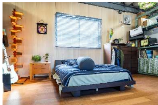
デザイン壁材『ハピアウォール ベーシックタイプ II』 壁パネル〈クリアベージュ〉