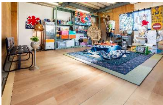
WPC 床材『ジオラナチュラル』 左画像 3P〈ウォールナット〉、右画像 2P〈バーチ〉